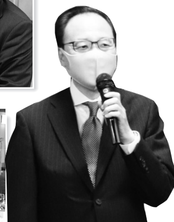
閉会挨拶： 本條会長エレクト