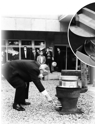
点 火 式