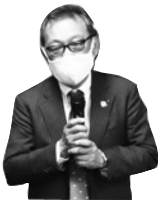
開会挨拶：神名会長