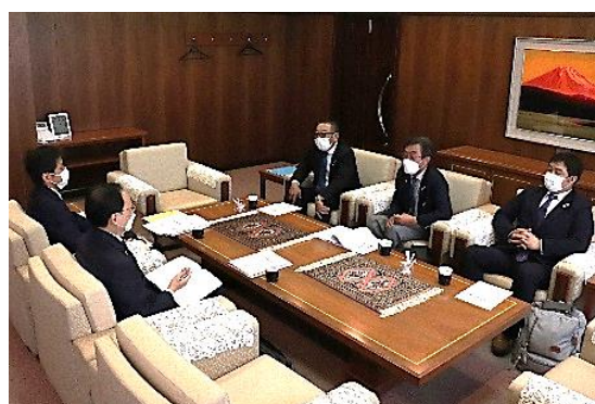
会長・幹事懇談会