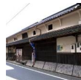
本家門前屋 (旧「三笑」酒蔵)

『三笑』は江戸時代天保年間(1830)から昭和52年(1977)まで約150年にわたって栄栗山崎に実在した銘柄の日本酒